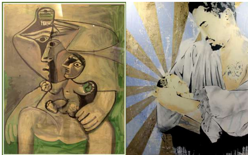
Peinture de Pablo Picasso / Peinture de Don Mateo

« Il est trois heures du matin. L'étable est glaciale. Le feu s'étiole. Les rois mages, les bergers, les anges sont partis se coucher. L'Enfant est dans la mangeoire. Il hurle, depuis des heures. « Qu'est-ce qu'il a ? Mal au ventre, froid, faim, soif, angoisse, qu'est-ce qu'il a ? » Marie dégrafe son corsage, l'Enfant se tait, il boit, il tète... ».