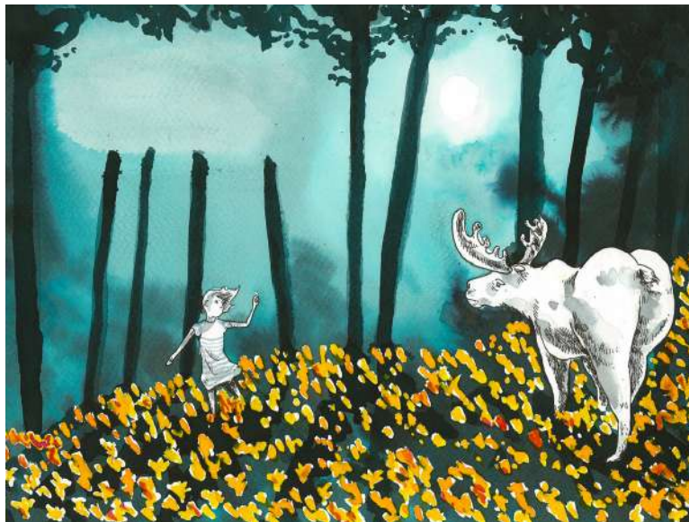
Illustration de Théau Namur / Texu

Mes parents sont partis aux Etats-Unis. « Pendant un mois, ils ont dit, Et toi, Suzie, tu resteras chez Mamie. » Pendant un mois ils ont dit.