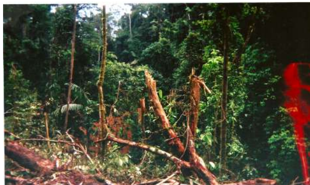
prise en Amazonie

« Je pourrais vivre ici toute ma vie. Dans ce foyer, ils sont huit, huit êtres humains, une famille. Ils sont très riches, ils possèdent quatre objets : une machette, un bol, un récipient pour faire la « chicha ». Le quatrième objet ? C'est la forêt ».