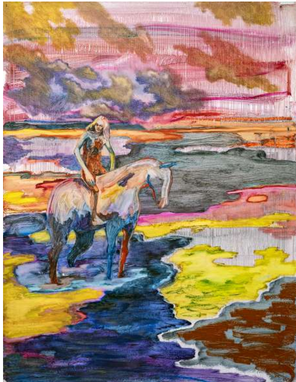
Peinture de Sarah Jérôme.

Public : Tout public, dès 14 ans En scolaire : dès le lycée.