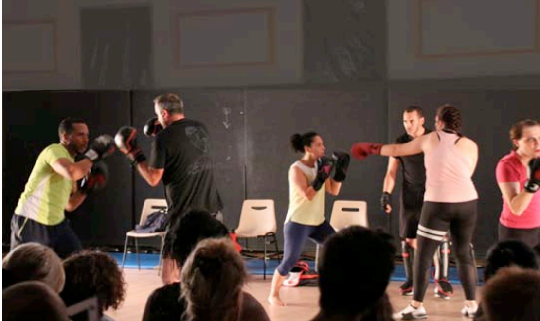
Représentations juin 2022 au théâtre Jérôme Savary